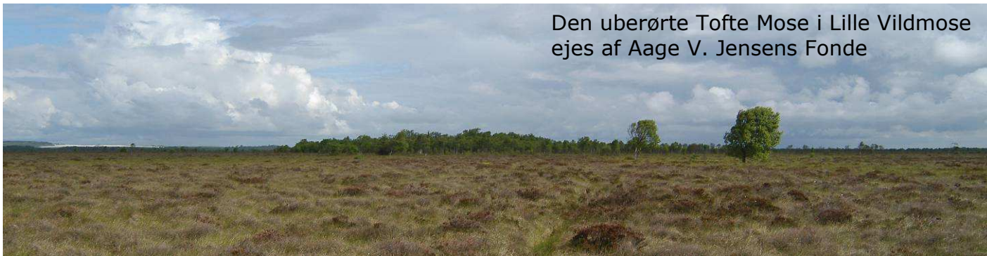
Den uberørte Tofte Mose i Lille Vildmose ejes af Aage V. Jensens Fonde

Når man søger forskellige steder, så er det ikke bare lige at skifte navn og adresse foroven på ansøgningen. De forskellige fonde eller råd har forskellige ansøgningskemaer, som skal udfyldes meget omhyggeligt, og hver fond eller råd lægger vægt på forskellige ting, hvorfor ansøgningen specifikt skal udformes, således at specielt disse ting fremhæves og beskrives. Endvidere har de forskellige fonde og råd meget forskellige ønsker om hvilke dokumenter, der skal medsendes.