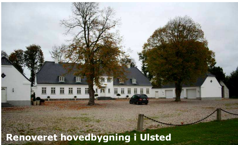
Renoveret hovedbygning i Ulsted

Vores Samrådsformand, som er bygningsingeniør, er også formand for bedømmelseskomiteen, men erklærede sig selvfølgelig inhabil, og deltog derfor ikke i bedømmelsen i år.