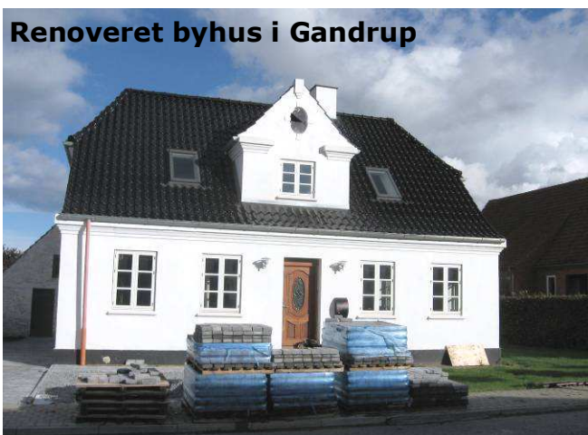
Renoveret byhus i Gandrup