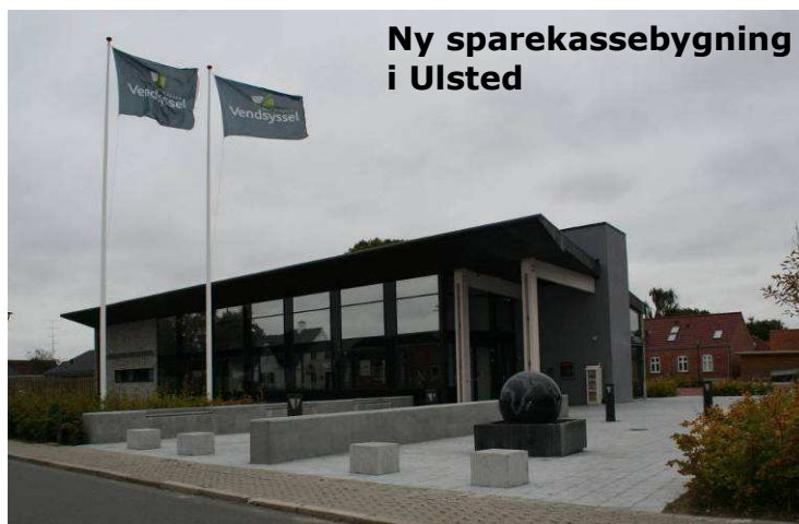
Ny sparekassebygning i Ulsted